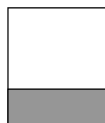
1/3 Seite (quer)